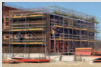
Állványok betonacél szereléshez